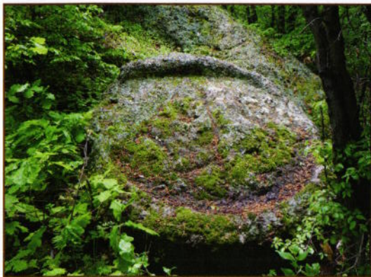
Олтарен камък Rock altar