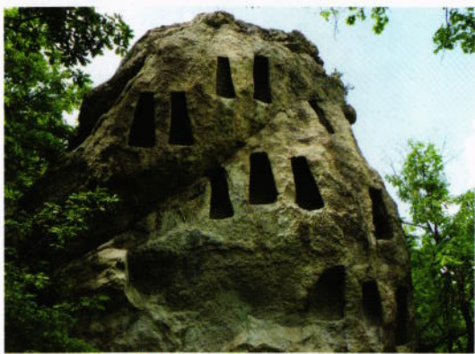
Трапецовидни ниши Rock-hewn trapezoid niches