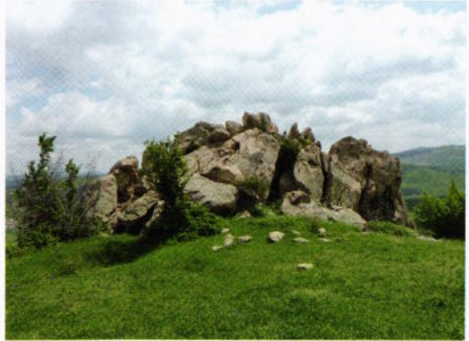
Скалният венец на хълма The rock wreath on top of the hill