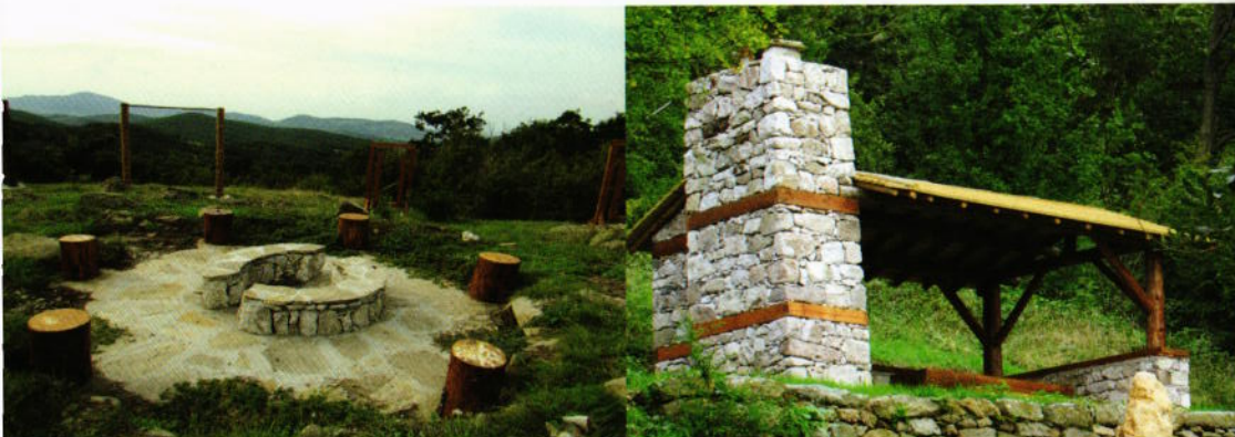
Места за отдих по пътеката

Проектът се осъществява с финансовата подкрепа на Програма за развитие на селските райони 2007-2013, съфинансирана от Европейския съюз чрез Европейски земеделски фонд за развитие на селските райони: Европа инвестира в селските райони