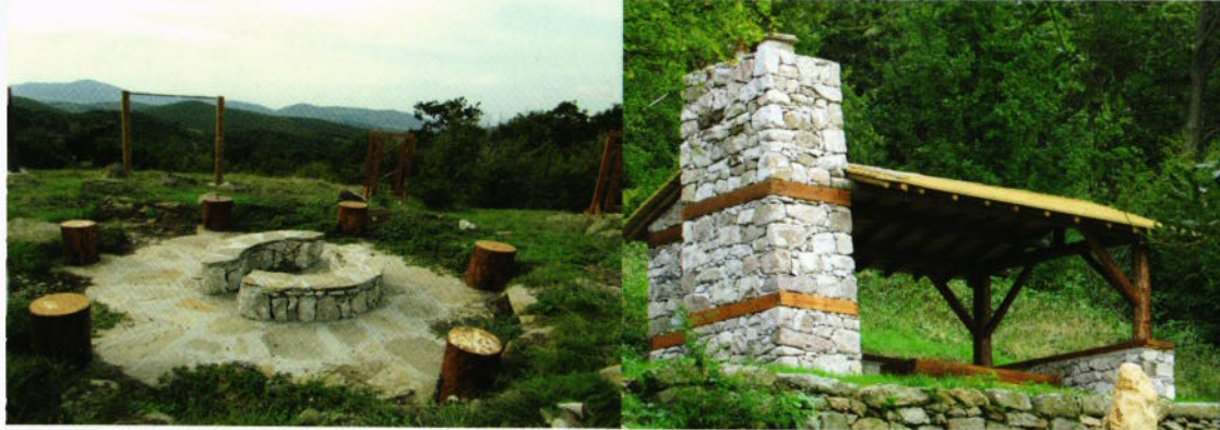
Места за отдих по пътеката

Проектът се осъществява с финансовата подкрепа на Програма за развитие на селските райони 2007-2013, съфинансирана от Европейския съюз чрез Европейски земеделски фонд за развитие на селските райони: Европа инвестира в селските райони