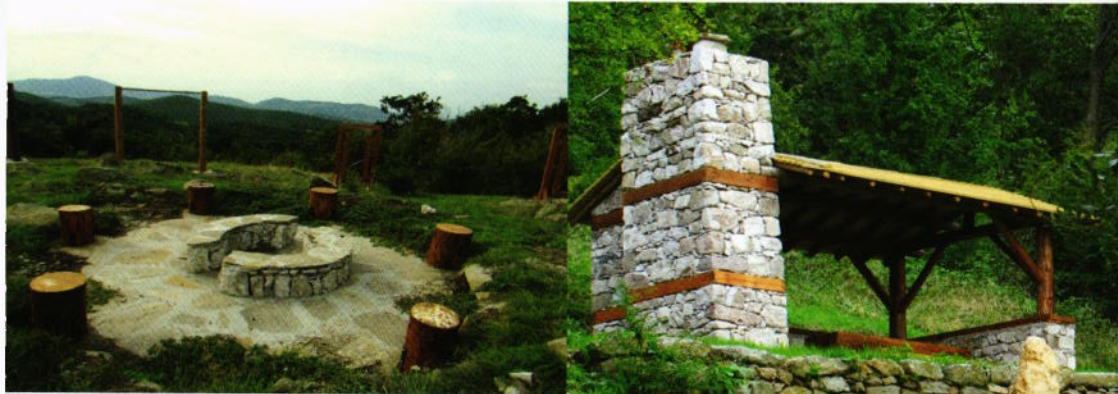
Места за отдих по пътеката

Проектът се осъществява с финансовата подкрепа на Програма за развитие на селските райони 2007-2013, съфинансирана от Европейския съюз чрез Европейски земеделски фонд за развитие на селските райони: Европа инвестира в селските райони